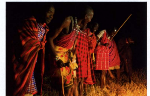
Massai-Krieger im Reiter-Camp. In ihren roten Gewändern führen sie traditionelle Tänze vor.